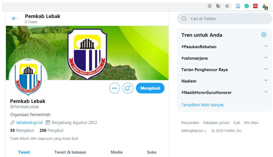
Gambar 3. Akun Twitter Resmi Pemkab Lebak

Akan tetapi, penggunaan media sosial seperti Twitter dan Instagram oleh Pemerintah Kabupaten Lebak belum dilakukan dengan aktif. Hal ini terlihat dari aktivitas yang terjadi dalam akun media sosial.